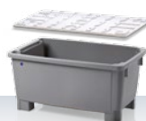
Kontener obrotowo-sztaplowany 300 l Akcesoria dodatkowe: pokrywa, 1200 × 780 × 580 mm