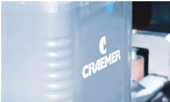
Przykład: Logo wykonane metodą gorącego stempla