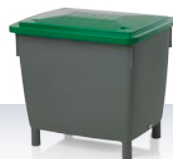
Kontener uniwersalny / Pojemniki na sól drogową i piasek 400 l Akcesoria dodatkowe: pokrywa nakładana lub pokrywa z zawiasami 945 × 725 × 830 / z pokrywą 930 mm Standardowe kolory: ■■■