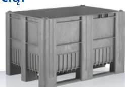
CB1 470 l 1200 × 800 × 740 mm Standardowe kolory: ■■■■