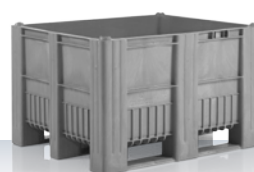
CB3 610 l 1200 × 1000 × 740 mm Standardowe kolory: ■■■■