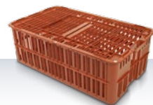
Skrzynka do transportu żywego drobiu 90 l 840 × 495 × 295 mm Dostępność na zapytanie