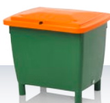
Kontener uniwersalny / Pojemniki na sól drogową i piasek 210 l Akcesoria dodatkowe: pokrywa nakładana lub pokrywa z zawiasami 790 × 605 × 685 / z pokrywą 775 mm Standardowe kolory: ■■■