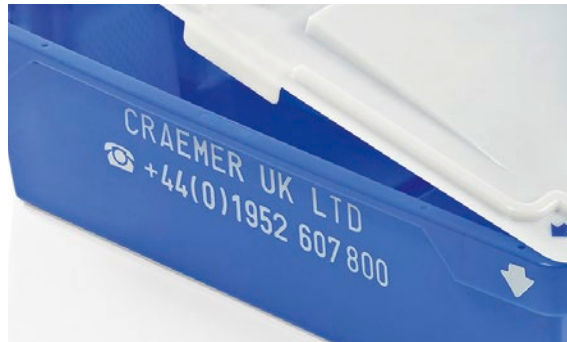
Przykład: Napis wykonany metodą gorącego stempla