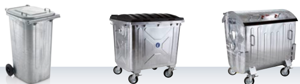
MGB pojemnik blaszany 240 l