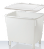
Kontener 400 l Akcesoria dodatkowe: pokrywa, wózek 945 × 725 × 830 mm