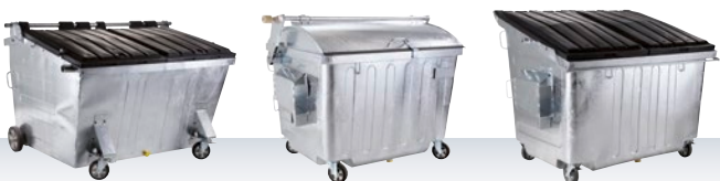
Pojemniki napełniane od tyłu 2500 l, 3000 l, 5000 l, 7000 l