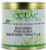
Owoce leśne BIO