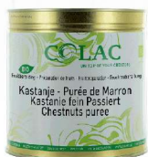
Puree kasztanowe BIO