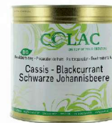
Czarna Porzeczka BIO