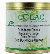
Rokitnik, pomarańcza BIO