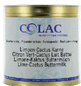
Limonka, kaktus, maślanka