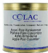
Jabłko, gruszka, ogórek