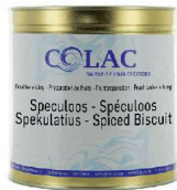
Ciastko z przyprawami