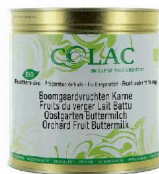
Owoce sadu, maślanka BIO