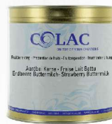
Truskawka z maślanką