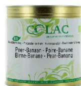
Gruszka, banan BIO