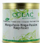
Mango, marakuja BIO