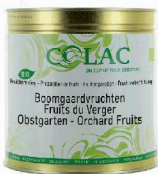
Owoce sadu BIO