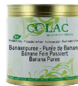
Bananowe Puree BIO