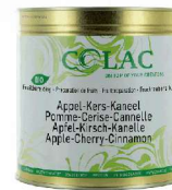
Jabłko, wiśnia, cynamon BIO