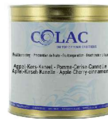
Jabłko, wiśnia, cynamon