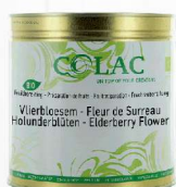
Czarny bez BIO