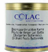
Owoce sadu, maślanka