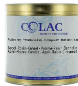
Jabłko, rodzynki, cynamon