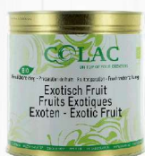
Owoce egzotyczne BIO