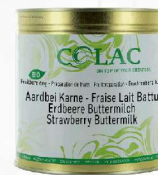
Truskawka z maślanką BIO