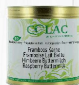
Malina, maślanka BIO