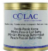
Brzoskwinia, marakuja, maślanka