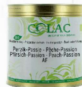
Brzoskwinia, marakuja BIO