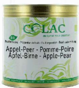
Jabłko, gruszka BIO