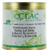
Czarny bez, maślanka BIO

Opakowanie: hermetycznie zamknięta puszką 3 kg, termin ważności 12 miesięcy od daty produkcji